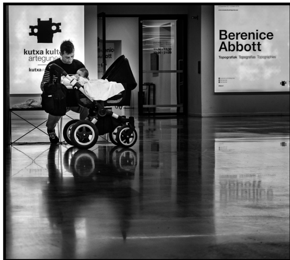
"Biberón Abbott" 2º Premio 2019 Kike Balenzategui Arbizu.